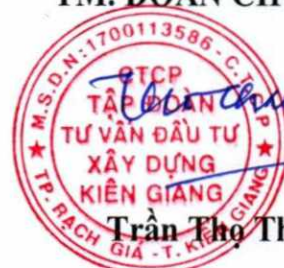
Trần Thọ Thắng